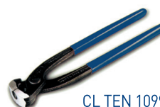
CL TEN 1099