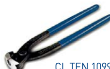
CL TEN 1099 Zange