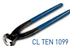
CL TEN 1099 Zange