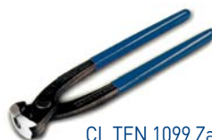
CL TEN 1099 Zange