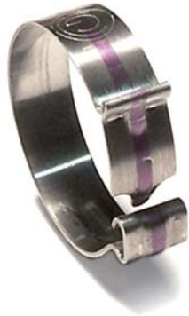
DCL OFFEN DCL GESCHLOSSEN

Klemme mit umlaufendem Band, Haken und Haltezahn, was auch eine zufällige Öffnung verhindert. Die Spannkraft wird gleichmäßig über die Klemme verteilt, die glatte Innenseite schützt den Schlauch vor Beschädigungen. Sie eignet sich dank der schnellen und einfachen Handhabung besonders für die industrielle Massenproduktion.